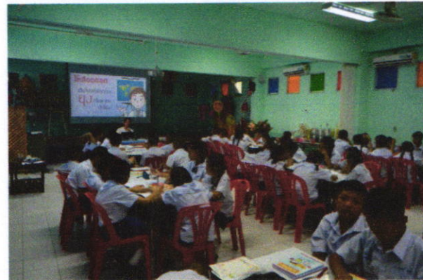
ภาพแสดงกิจกรรมวิทยากรให้ความรู้วิธีการดูแลป้องกันโรคเบาหวาน โรคความดันโลหิตสูง และโรคไขข้ออักเสบ