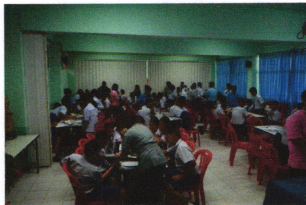
ภาพแสดงกิจกรรมวิทยากรที่เลี้ยงฝึกปฏิบัติการใช้เครื่องวัดความดันโลหิตแก่อสม.น้อย