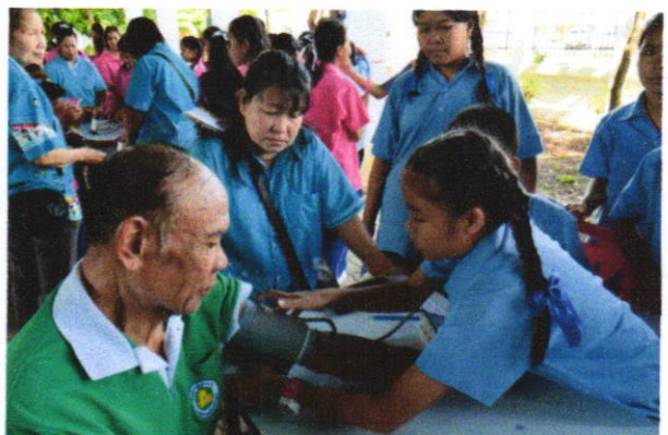
ภาพแสดงกิจกรรมอาสาสมัคร.น่ายเทศบาลเมืองลำพูน ฝึกปฏิบัติวัดความดันโลหิตสูงและวัดรอบเอวผู้สูงอายุ